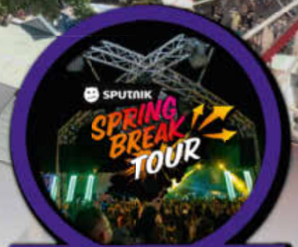
SUMMERPORT OPEN AIR