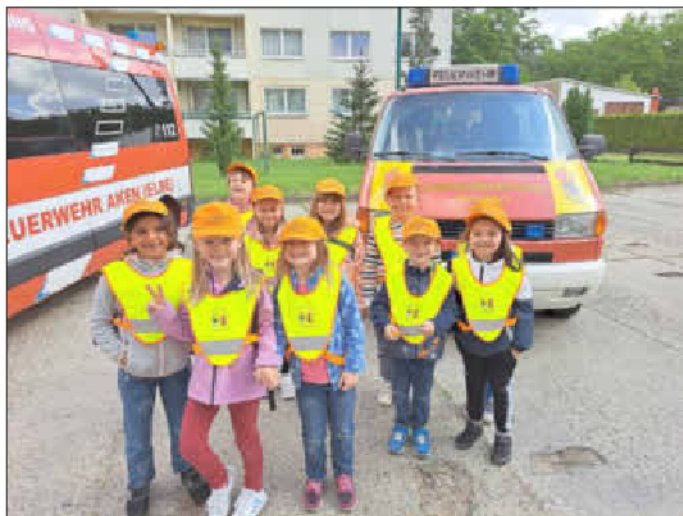
Die Vorschulkinder und Erzieher vom „ Pittiplatsch“