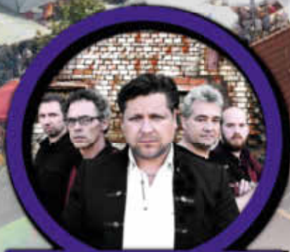
"KARAT" Tribute Seelenschiffe