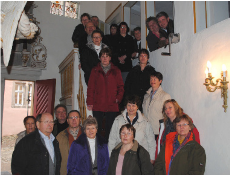
Nach dem Abschlussgottesdienst in der Kapelle der Burg Bodenstein.

Samstag Nachmittag war dann Gelegenheit, die nähere Umgebung zu erkunden. Es gab die Möglichkeit zum Besuch des Bärenparks, eine Fahrt nach Duderstadt oder eine Wanderung nach Worbis.