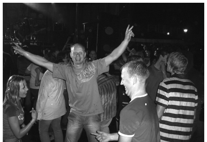
Trotz Regen - riesen Stimmung beim „Tänzchentee“