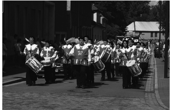
In jedem Jahr dabei - der Rosenburger Spielmannszug