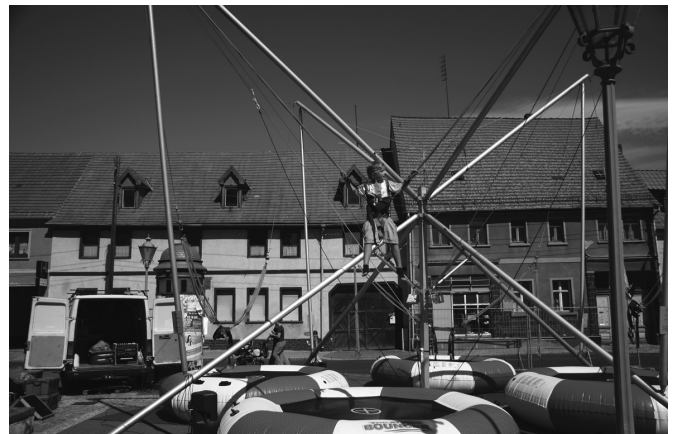
Auch für Kinder gab es viel zu entdecken