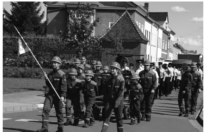
Jugend voran - Freiwillige Feuerwehr Aken